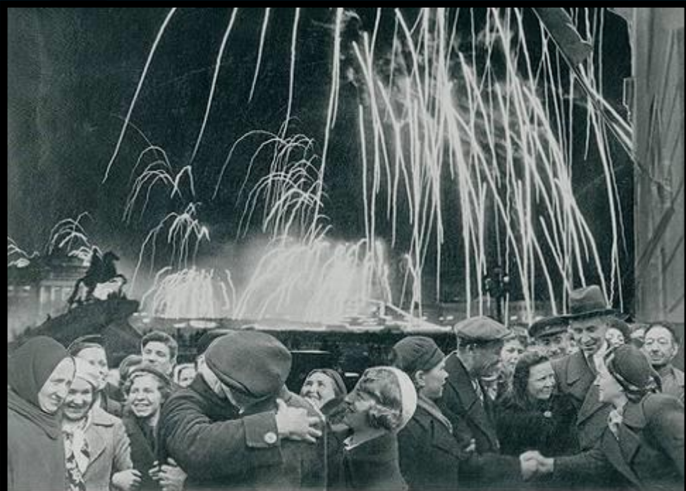
-ВЕЛИКАЯ ПОБЕДА ОДЕРЖАНА СОВЕТСКИМИ ВОЙСКАМИ ПОД ЛЕНИНГРАДОМ:

Победе радовалась вся страна, но эта радость была со слезами на глазах, так как в каждой семье, в каждом доме кто-то погиб на этой страшной войне.