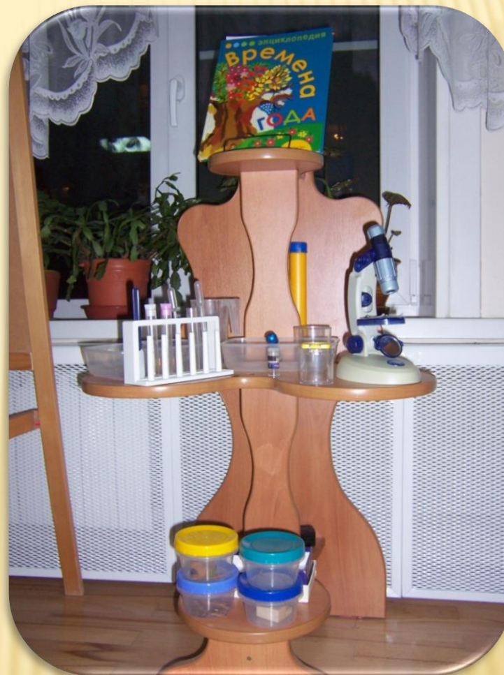
Центр «Опытно-экспериментальной деятельности»